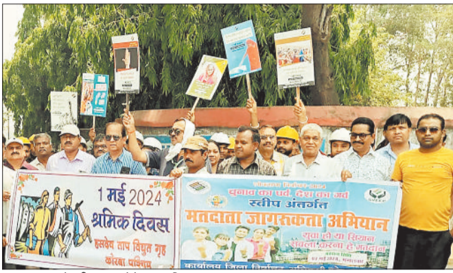
मतदान करने की शायत सेते हुए श्रमिक।

महिला श्रमिकों को श्रीफल एवं नममत्तदाओं को उपहार भेंट कर किया गया सम्मानित