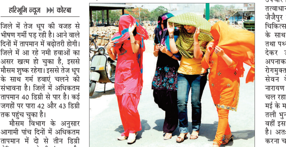
हरिभूमि न्यूज || कोरबा

जिले में तेज धूप की वजह से भीषण गर्मी पड़ रही है। आने वाले दिनों में तापमान में बढ़ोतरी होगी। जिले में आ रहे नमी हवाओं का असर खत्म हो चुका है, इससे मौसम शुष्क रहेगा। इससे तेज धूप के साथ गर्म हवाएं चलने की संभावना है। जिले में अधिकतम तापमान 40 डिग्री से पार है। कई जगहों पर पारा 42 और 43 डिग्री तक पहुंच चुका है। मौसम विभाग के अनुसार आगामी पांच दिनों में अधिकतम तापमान में दो से तीन डिग्री सेल्सियस बढ़ाने की संभावना है। इसके बाद तापमान में कोई परिवर्तन की संभावना नहीं है। मौसम एक्सपर्ट का कहना है कि बंगाल की खाड़ी से आ रही नमी हवाओं का असर प्रदेश में खत्म हो चुका है। इससे प्रदेश में मौसम शुष्क रहेगा। तेज धूप के साथ भीषण गर्मी पड़ने की संभावना है। मौसम का मिजाज कुछ दिनों तक