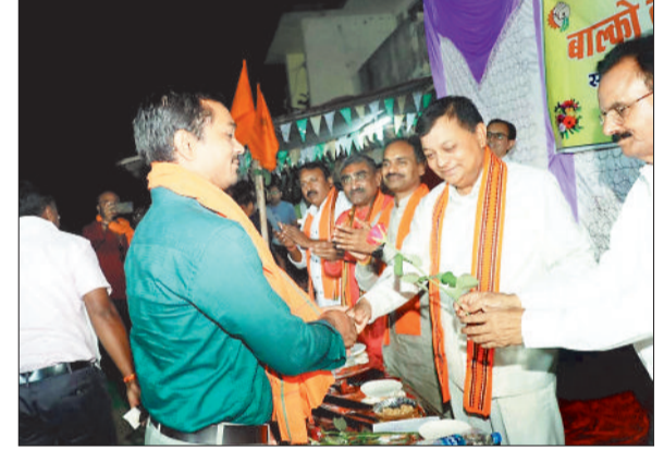
उद्योग मंत्री का स्वागत करते कर्मी।

बालको में बीएमएस के सम्मेलन में शामिल हुए श्रम मंत्री