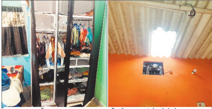
टूटा हुआ अलमारी। टूटी हुई छप्पर जहां से घुसे थे चोर।

बालको संयंत्र में एक निजी कंपनी में काम करने वाले युवक अपने परिवार के शादी समारोह में शामिल होने के लिए गया हुआ था। इस बीच सूनेपन का फायदा उठाते हुए चोरों ने उसके छप्पर को तोड़कर उसके घर के भीतर घुस गए और अलमारी का ताला तोड़कर अलमारी में रखे लाखों रुपए नगदी सहित सोने चांदी के जेवरात को चोरों ने पार कर दिया है। मकान मालिक जब वापस लौटा तो घर का नजारा देख उसके होश उड़ गए और उसने इस मामले की शिकायत पुलिस से की है। पुलिस मामले में अज्ञात चोरों के खिलाफ अपराध पंजीबद्ध कर मामले की तहकीकात में जुटी हुई है।