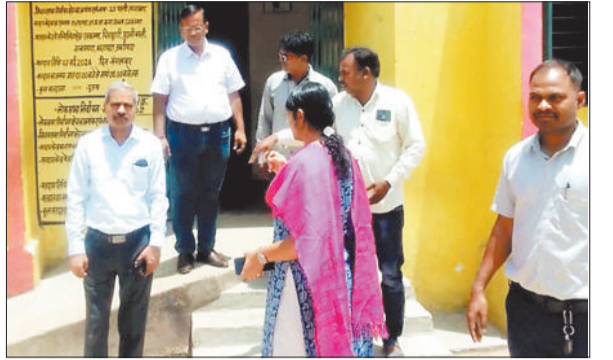
मतदान केंद्र का निरीक्षण करते प्रेक्षक।